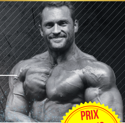
COUP DE CŒUR DE STANIMAL TEAM ERIC FAVRE®